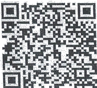
QR Code วิธีการลงทะเบียน และการรับสมัคร