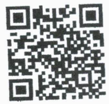
สิ่งที่ส่งมาด้วย ๒

ที่ทำการปกครองอำเภอ กลุ่มงานบริหารงานปกครอง งานปกครอง โทร/โทรสาร ๐-๕๓๔๙-๕๗๘๑