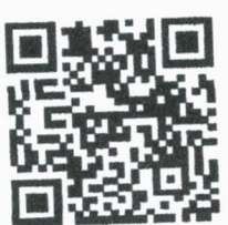
สิ่งที่ส่งมาด้วย ๑

หัวหน้าฝ่ายบริหาร ปฏิบัติหน้าที่ หัวหน้าศูนย์ส่งเสริมสหภาพ