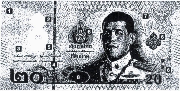
ขนาดกว้าง 72 มม. ยาว 138 มม.